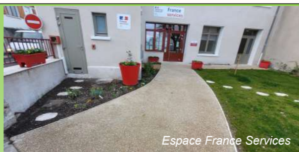
Espace France Services

Quelques élagages vont avoir lieu sur la commune en tenant compte de la période de nidification. La cour de l'Espace France Services est maintenant toute fleurie et pleine de couleurs. L'espace Genevoix a aussi un très bel aspect coloré grâce à ses nouveaux bancs.