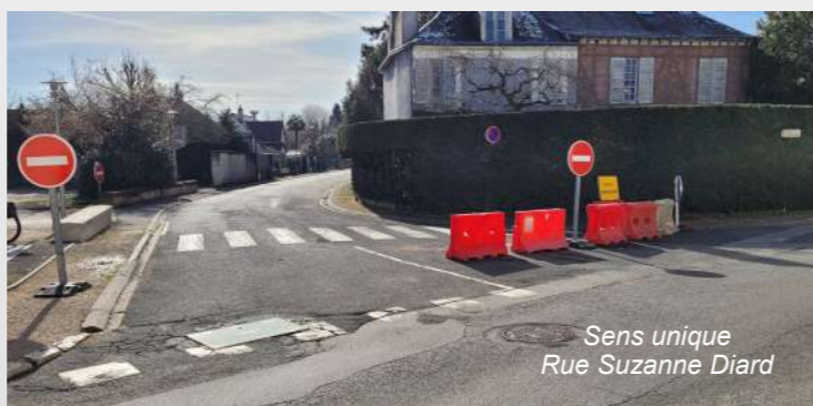
Sens unique Rue Suzanne Diard

La protection d'Onzain a aussi été renforcée en 2023 avec la pose de nouvelles caméras de vidéo protection sur la place d'Onzain.